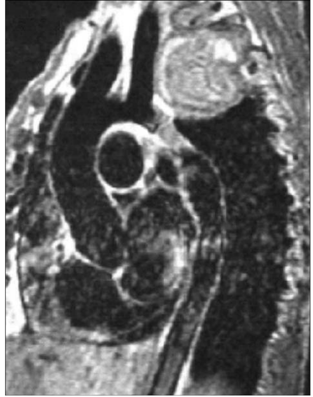
Şekil 3. Aort koarktasyonu ve interkostal arter anevrizması manyetik rezonans inceleme.