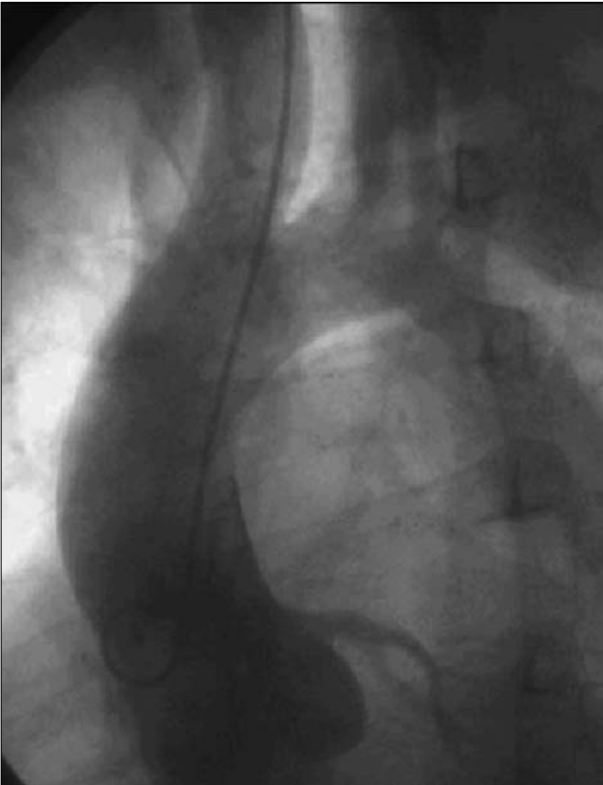
Şekil 2. Aort koarktasyonu ve interkostal arter anevrizmasının anjiyografi görüntüsü.