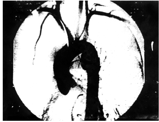
Resim 1: İlk hastanın aortografisinde desandan aortadaki görünüm

Hastanın klinik tablosu ve CT bulguları arasındaki uyumsuzluk nedeniyle yapılan aortografide, desandan aortada, sol subklavyan arter distalindeki 7 cm'lik segmentte damar bütünlüğünün kaybolduğu belirlendi (Resim 1). Bu lezyon