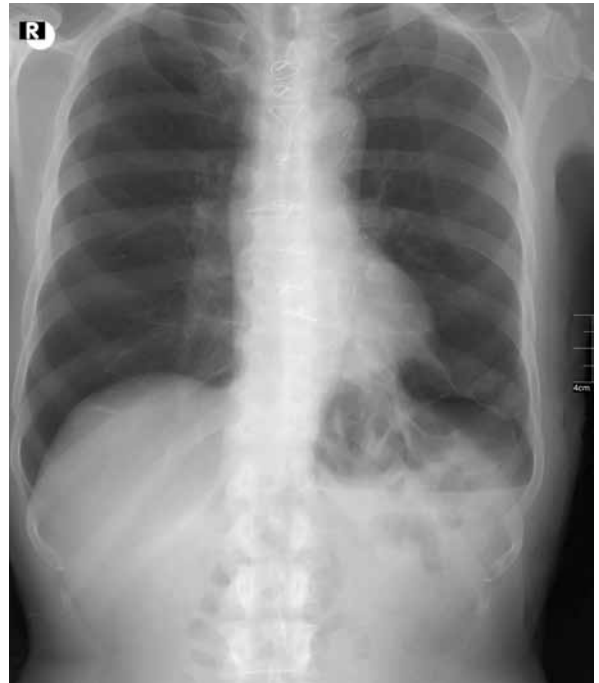
Şekil 3. Taburculuk sonrası kontrol akciğer grafisi.