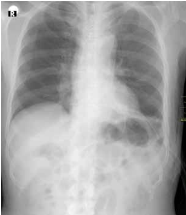
Şekil 2. Sol tüp torakostomi.

Nadir bir durum olan şilotoraks torasik kanalın tıkanmasına ya da bütünlüğünün bozulmasına bağlı olarak lenf sıvısının plevrada birikmesidir. Kardiyotorasik ameliyatlardan sonrası %0.5-2 oranında görülen kalıcı şilotoraks yaşamı tehdit eden önemli bir komplikasyondur. [1] Erken tanı konup tedavi edilmediği takdirde yüksek bir morbidite ve mortalite ile seyrebilmektedir. İlk olarak 1633 yılında Bartolet tarafından tanımlanmış ve efüzyonun süt benzeri görünümü