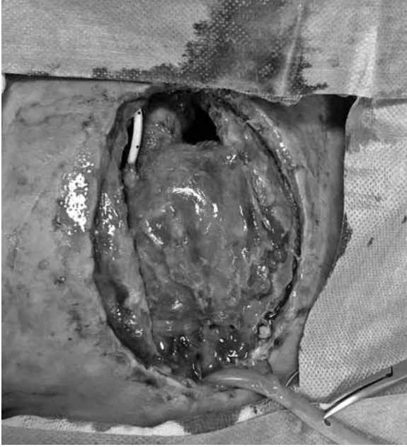
Şekil 1. Ameliyat sonrası açık sternumla takip edildikten sonra mediastinit gelişen olgu.