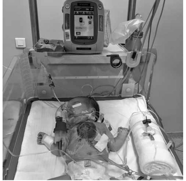
Şekil 2. Yoğun bakımda vakum destekli kapama tedavisi uygulanan olgu görüntüsü.

(Şekil 1). Nekrotik ve enfekte dokuların debridmanı yapıldı. Daha sonra, 400-600 mikron genişliğinde mikroporlardan oluşan steril poliüretan köpük pansuman materyali (V.A.C.® GranuFoam™, KCI USA, Inc., San Antonio, TX), yara büyüklüğüne uygun şekilde kesilerek mediastene yerleştirildi. Son iki hastada, dokuların üzerine yapışmayı önleyici örtü (Adaptic Touch™, Systagenix, Gatwick, UK.) konuldu. Yaranın üzeri transparan adeziv örtü ile kapatıldıktan sonra, örtü üzerinde açılan açıklığa kollaps olmayan boşaltıcı tüp (V.A.C.® VeraT.R.A.C.™ Pad, KCI USA, Inc., San Antonio, TX) yapıştırıldı. Boşaltıcı tüp ile jelli rezervuar (Info V.A.C.® Canister™, KCI USA, Inc., San Antonio, TX) bağlantısı yapıldı. Rezervuarın negatif basınçli tedavi ünitesine (V.A.C.Ulta™, KCI, San Antonio, US) bağlantısı yapılarak VAK tedavisine sürekli modda 75 mmHg negatif basınçla başlandı (Şekil 2). Vakum destekli kapama tedavisi sonlandırılana kadar, 72 saatte bir yapışmayı önleyici örtü, poliüretan köpük, boşaltıcı tüp ve rezervuar değiştirilerek tedaviye devam edildi.